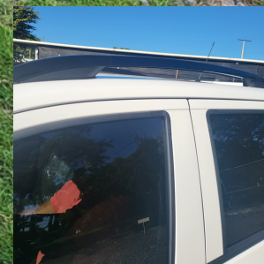
Barra de techo